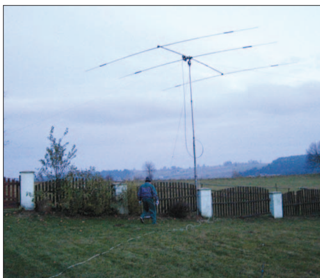
Yagi az OK-OM versenyre