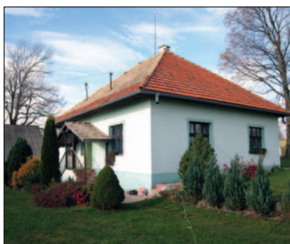
A QTH-nk Vrch Dobrocon

my self home building, TX-Power: 5 W from 2SC1969, Antenna: R1-Dipol. *** HG5A /Simon: Ha marad ez a kiírás, soha többet nem veszünk részt! Ez nem fehér embernek való! *** YU7LN : Az összes QSO-t 80 méteren teremttem, és mindig betartottam a szabályokat. 10 wattal dolgoztam. 73 DX! *** DL3MCI : RIG Yaesu FT-817, Pwr 5 Watt, Antenna Bazooka. *** HA7WP : Jó kis verseny! *** G/HA8RC : Énnyi össze-