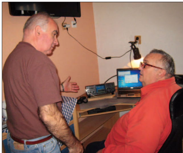
HA7PL és HA6NL