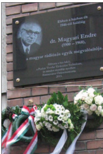
Emléktábla a IX. kerületben

melletést tapasztalt műszerészek, később fiatal technikusok végezték 24/48 órás váltásban. Kezdetben 5, a végén 27 zavaróadóval. A zavarandó frekvenciákat egy Pesttől távoli, (tehát nem zavart) helyen elhelyezkedő vevőközpontból adták meg naponta telefonon.