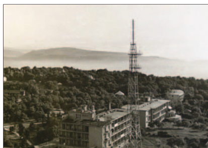
1. ábra. A Hargita Szálló épülete a budapesti Széchenyi-hegyen. Mellette az 1 kW-os BHG adó szuper Turnstyle antennája rácsos szerkezetű antenntornyon

követte a tv-szabványok elfogadásában, hanem a Szovjetunió által létrehozott OIRT (Organisation International du Radio et Television) „keleti” előírásait. Ugyanez volt a stratégiai alapja még a cári időkben alakult vasúti vágányméret különbségnek is, azért, hogy ne lehessen az orosz vasútvonalakon nyugati gördülő anyaggal haladni. Természetesen itt a hadianyag szállítás volt a stratégiai indokolás alapja. Ugyanez a hozzáállás mutatkozott meg az OIRT szervezet létrehozásánál, amely szervezet a nyugati – veszélyt jelentő – információcserét kívánta megelőzni a határokat nem ismerő nagyfrekvenciás hullámok területén. Ezért aztán egy, a Szovjetunióban gyártott tv-vevővel nem lehetett nyugati adót fogni, mert annak nem volt hangja az eltérő kép-hang vivotávolság miatt (5,5 MHz helyett 6,5 MHz). Ugyanilyen okból használta a keleti blokk az OIRT URH-FM sávon a 66...74 MHz-es frekvenciákat a már jól bejáratott, CCIR ajánlású akkori 87,5...100 MHz tartomány helyett.