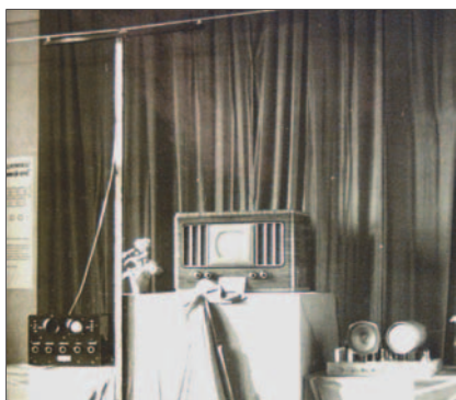
2. ábra. Az 1954-es Rádióamatőr kiállításon kiállított tv-vevőm, amelynek csak a hangcsatornája működött (bal oldalt a dipól antenna alatt)

en. Az Einheitsempfänger fejlesztését (ez volt a Göbbels-i Volksempfänger rádióvevő tv-megfelelője) az 1936-os Berlini Olimpia sikeres tv-közvetítése után vették programba az AEG Telefunkennél. A tv elterjesztését az egész szocialista táborban szorgalmazták, mert megértették a képi információk az emberi gondolkodásmódra gyakorolt nagyon jelentős hatását. Amint 1925 táján a rádió volt a széles tömegekre ható kommunikáció eszköze, úgy a háború utáni évek, évtizedek a televízió rohamos elterjedésének időszaka lett Európában. Nálunk az 50-es évek végén indult ez az időszak, amikor igyekeznünk kellett, hogy utolérjük a nyugatot ezen a területen is.