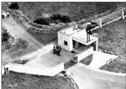
21. ábra. Az állomás bejárati kapuja a 7. emelet erkélyéről nézve