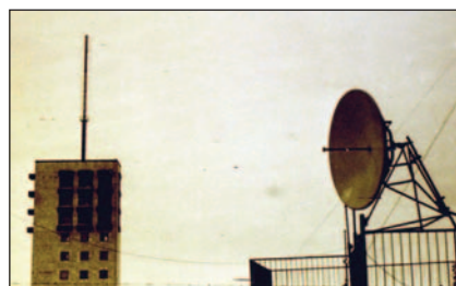
19. ábra. A BHG beadó-mikró vevőoldali antennája a Hargita-Szálló tetején