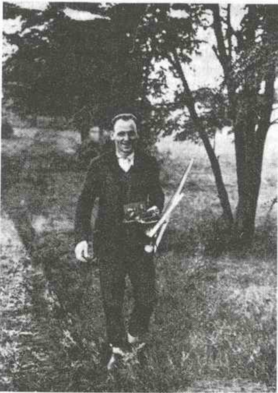
Beérkezik az első versenyző